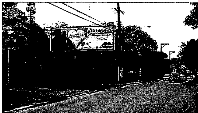
ENDEREÇO: Rua Quintino Bocaiúva NUMERO: 1455 – Face Cidade – Placa 01

NOTA IMPORTANTE = Neste relatório deve anexar fotos coloridas do imóvel indicando no mínimo os seguintes itens do painel :