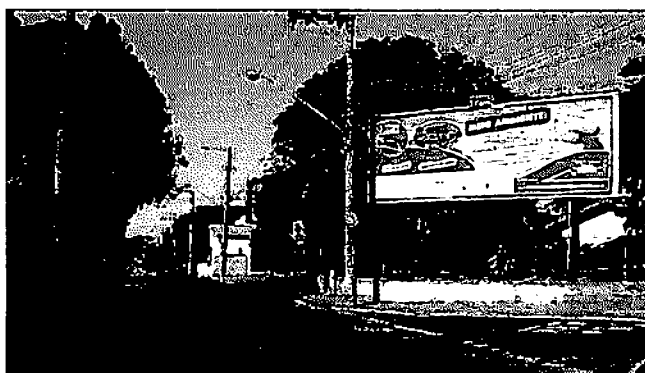
ENDEREÇO: Rua Quintino Bocaiúva NUMERO: 1455 – Face Bairro – Placa 02